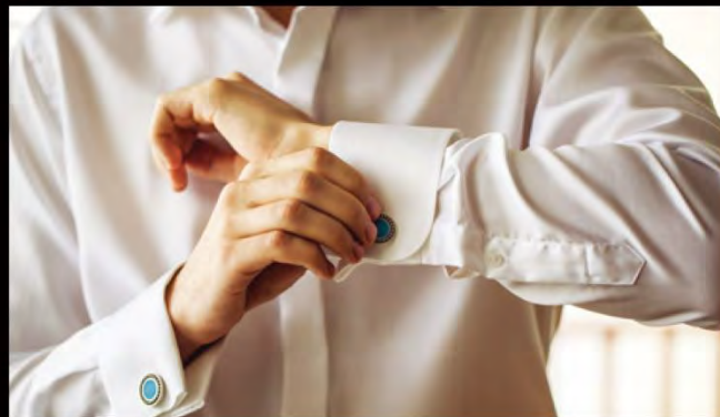
ワイシャツやブラウス