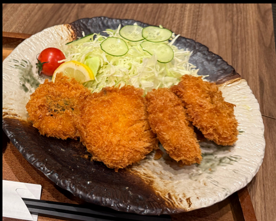
しそチーズかつ1枚