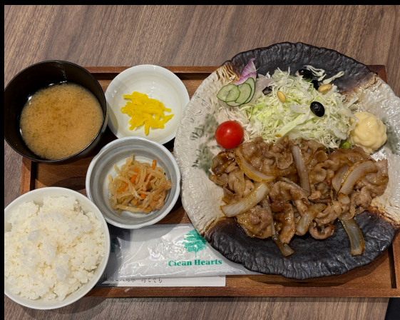
しょうがやき定食