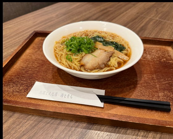
ラーメン(醤油・みそ)