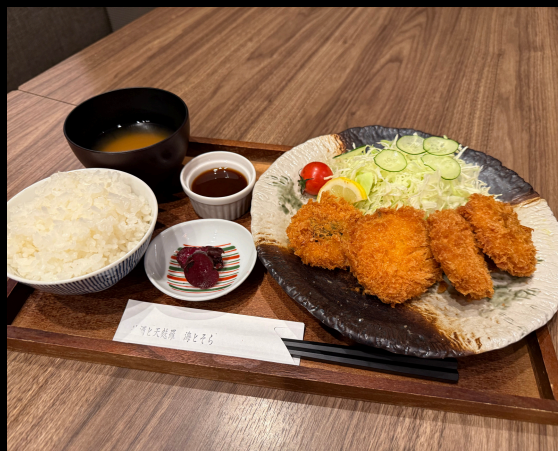
しそチーズかつ定食