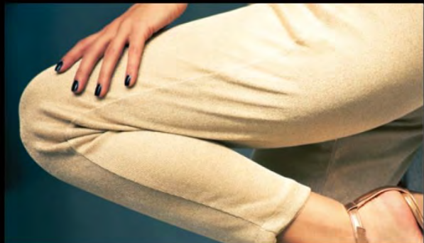
ウール素材のパンツ