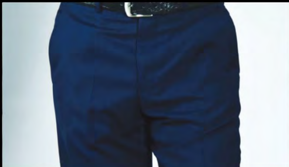
レーヨン素材のパンツ

スーツや礼服などのプリーツ(折り目)はしっかりと残しながら、全体のしわを除去します。パンツスタイルで気になるプリーツを残したまま、縮みや傷みの気になる衣類のお手入れができます。